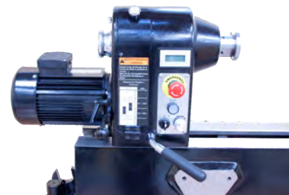
Antriebseinheit schnell verstellbar