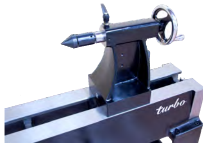
extra schwerer Reitstock