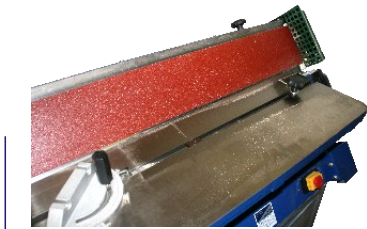
Schleifbandkipfung 45 Grad